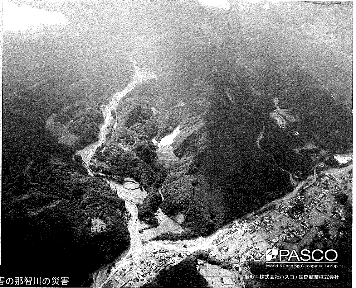
2011年紀伊半島災害の那智川の災害